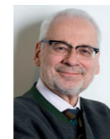
Dr. Erhard Busek (IDM) Vorstandsvorsitzender